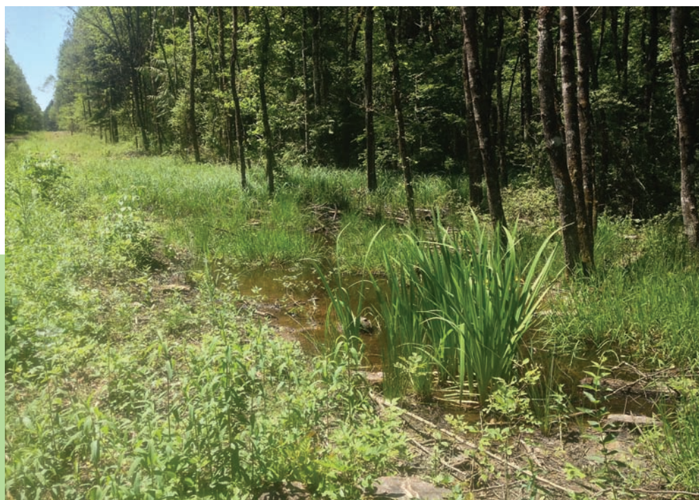
Importance régionale (sonneur à ventre jaune, triton alpestre, triton palmé, grenouille rousse).

visant à protéger le 10 % des sites les plus riches du pays, a été utilisée avec succès dans la révision de l'inventaire fédéral actuellement en cours. Bien que satisfaisante pour identifier les milieux abritant des communautés de batraciens particulières, elle laissait de côté 90 % des sites connus. Dans un souci d'uniformisation, le Karch et le service conseil de l'inventaire propose ici une clé permettant de déterminer l'importance cantonale ou locale des sites de reproduction de batraciens.