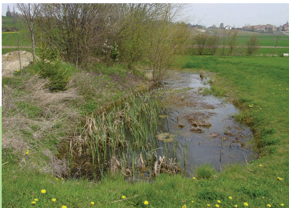
Lokale Bedeutung (Grasfrosch, Erdkröte und Bergmolch) (Foto: Jérôme Pellet).

Im Jahr 2012 publizierte das BAFU einen neuen Bewertungsschlüssel für die Amphibienlaichgebiete (PELLET et al. 2012). Dieser basiert im Wesentlichen auf den vorkommenden Arten, ihrer Seltenheit und ihrem Gefährdungsgrad und bestimmt, ob ein Objekt nationale Bedeutung im Sinn der Amphibienlaichgebiete-Verordnung (AlgV) erreicht. Dieser Ansatz, welcher die rund 10 % bedeutendsten Laichgebiete des Landes erfassen